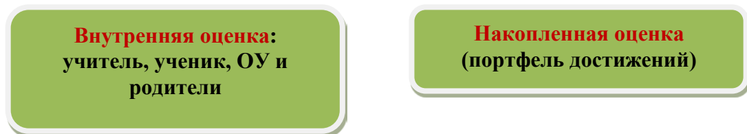
Рис. 2. Система оценки достижения планируемых результатов

В соответствии с ФГОС ООО основным объектом системы оценки результатов образования, её содержательной и критериальной базой выступают требования Стандарта , которые конкретизируются в планируемых результатах освоения обучающимися основной образовательной программы основного общего образования.