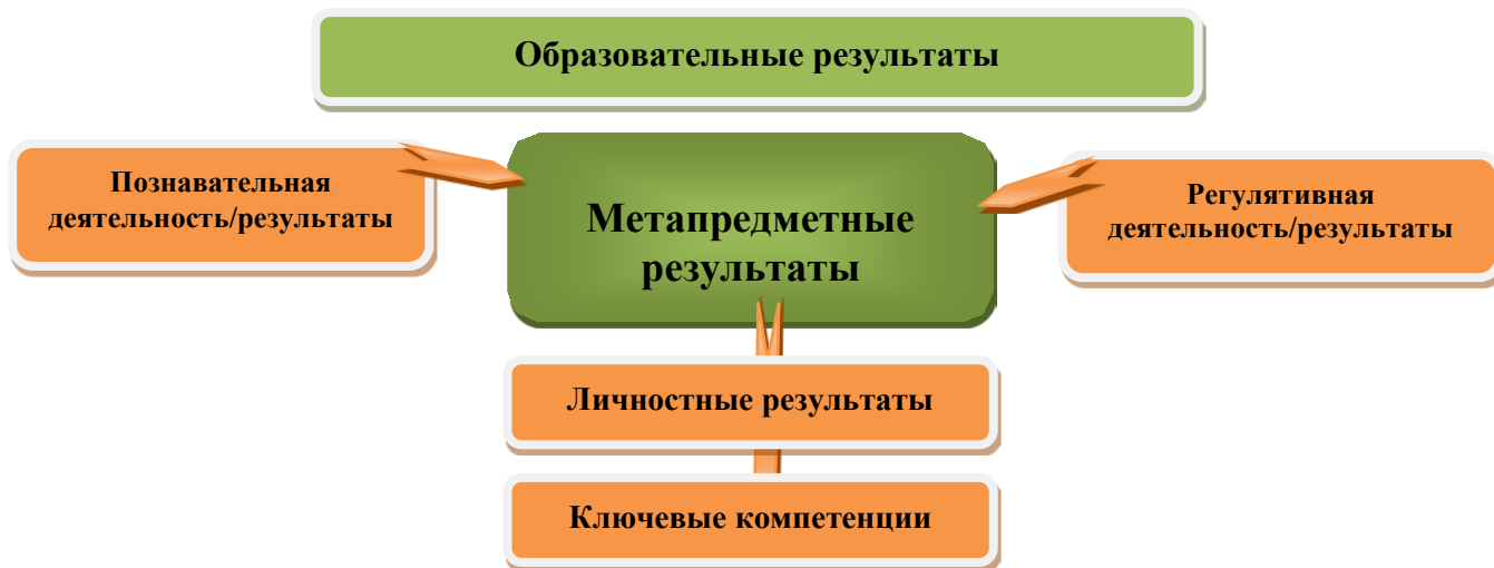
Рис. 3. Система оценки образовательных результатов

Система оценки предусматривает уровневый подход к представлению планируемых результатов и инструментарий для оценки их достижения. Согласно этому подходу за точку отсчёта принимается не «идеальный образец», отсчитывая от которого «методом вычитания» и фиксируя допущенные ошибки и недочёты, формируется сегодня оценка ученика, а необходимый для продолжения образования и реально достигаемый большинством учащихся опорный уровень образовательных достижений. Достижение этого опорного уровня интерпретируется как безусловный учебный успех ребёнка, как исполнение им требований Стандарта. А оценка индивидуальных образовательных достижений ведётся «методом сложения», при котором фиксируется достижение опорного уровня и его превышение. Это позволяет поощрять продвижения учащихся, выстраивать индивидуальные траектории движения с учётом зоны ближайшего развития.